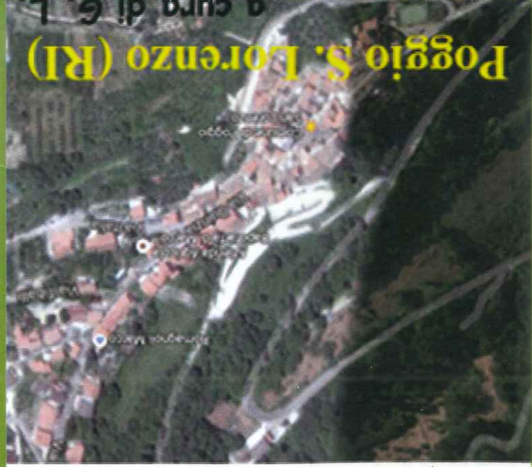
Poggio S. Lorenzo (RI) a cura di G. L.