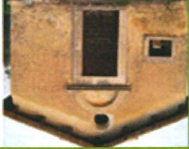
P3/P4 Madonna di Capofarfa e Leccio di Valle Gemma

(P3) Da Piazza G. Marconi si prende via di Capofarfa, una leggera salita, tratto pianeggiante ed infine discesa.