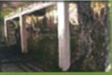
P7 Fonte dei Tiballi

Distanza totale 3,25 km - Durata 1h e 50'