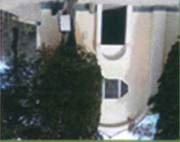
P5/P6 Madonna dei Penitenti e Grotte

(P5) A metà paese si svolta a sinistra sotto una bella arcata, in discesa fino al fosso del Penitenti; si comincia a salire tenendosi a destra per strada di campagna, poi si attraversa un uliveto; alla sommità si svolta a sinistra.