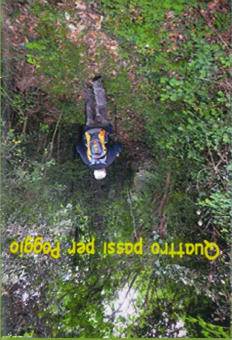
Quattro passi per Poggio