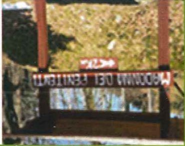
P1/P2 Cammino di S. Francesco